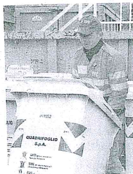
Rispetto allo scorso anno la tariffa è rimasta stabile