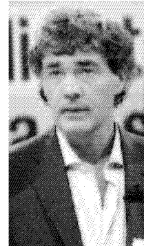
GILETTI Il conduttore televisivo è un noto tifoso juventino