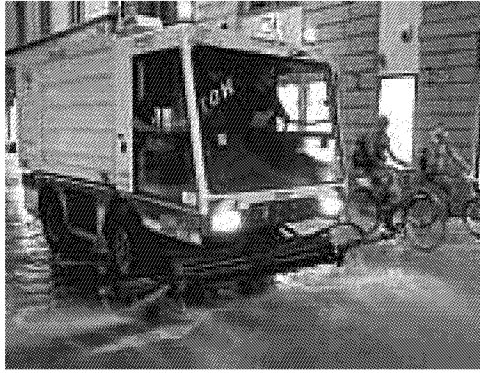
Cambiano gli orari delle pulizie