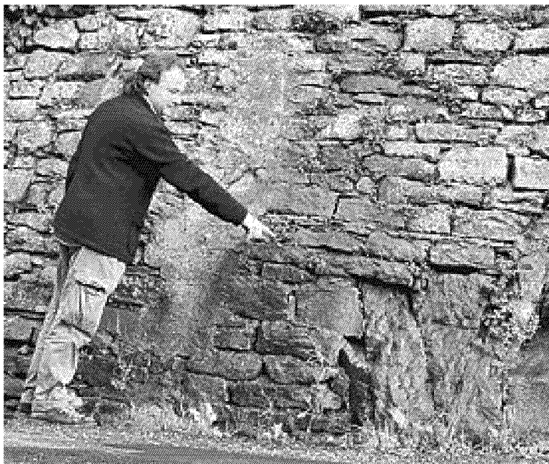
PROTESTA L'Associazione culturale Amici di Fontelucente protesta contro l'amministrazione per lo stato della zona

una proposta di allacciamento ma anche la pessima organizzazione della raccolta dei rifiuti». «Completamente fallimentare» è definito infatti il sistema del "porta a porta", visto che le differenti tipologie di sacchetti vengono raccolti rarissimamente e tutti insieme. Cruccio dei residenti è da sempre la viabilità. Sebbene di difficile percorrenza, via Fontelucente è molto trafficata e neppure le sollecitazioni del difensore civico comunale sono riuscite a far adottare dei provvedimenti in modo da rallentare almeno la velocità.