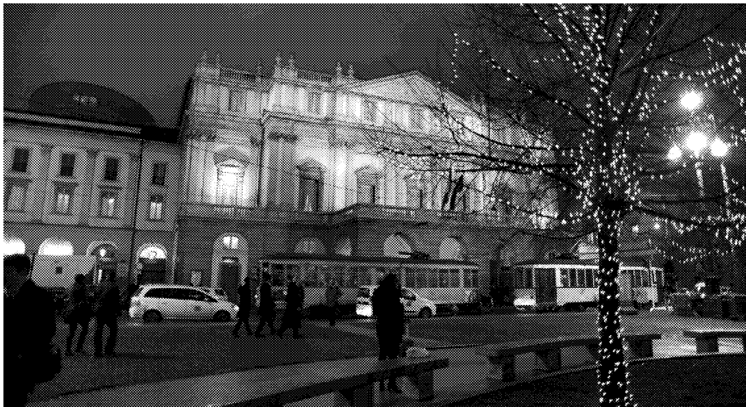
MILANO. Addobbi natalizi al Teatro alla Scala