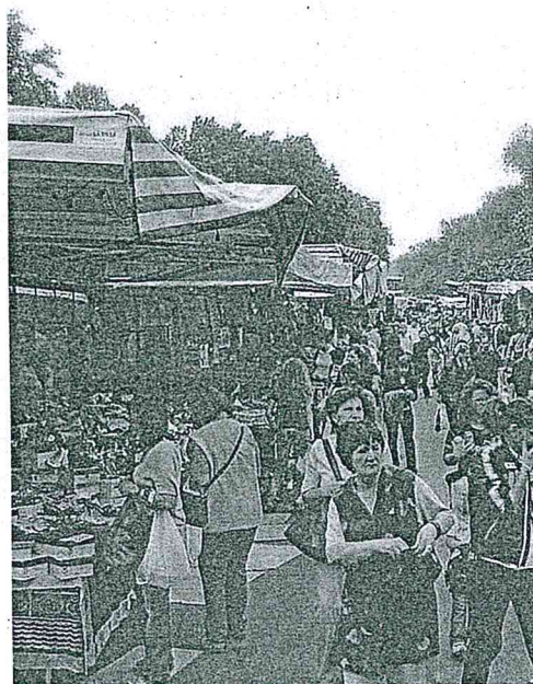
Vecchia foto della Festa del grillo; mercato delle Cascine